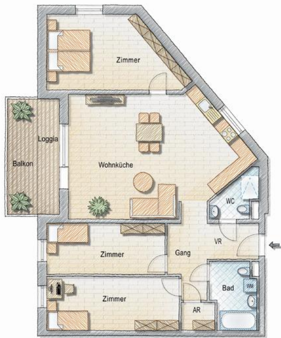
Grundriss - 4 Zimmer