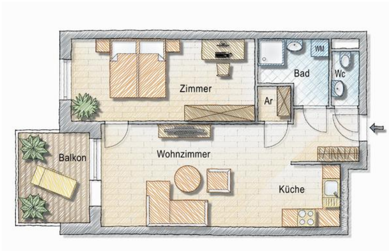
Grundriss - 2 Zimmer