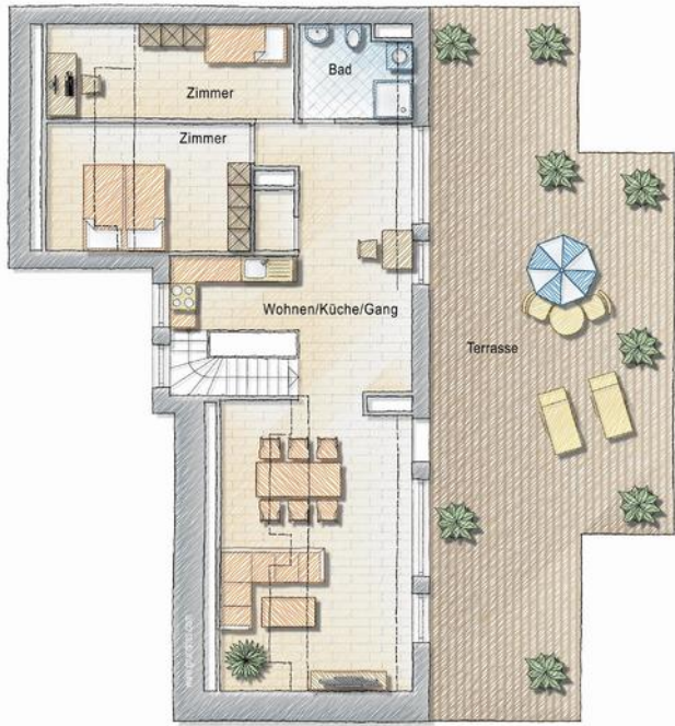
Grundriss - 4 Zimmer - OG