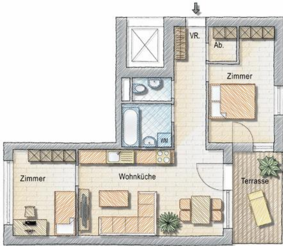
Grundriss - 3 Zimmer