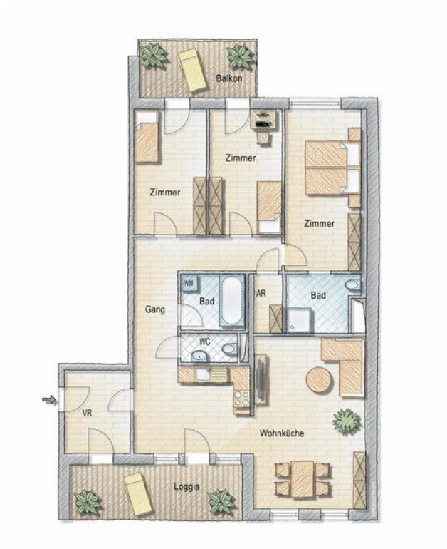
Grundriss - 4 Zimmer