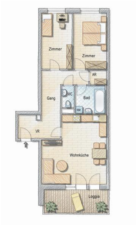
Grundriss - 3 Zimmer