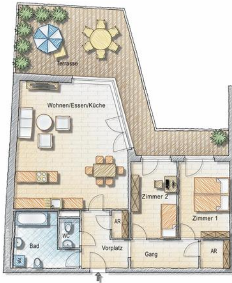
Grundriss - 3 Zimmer