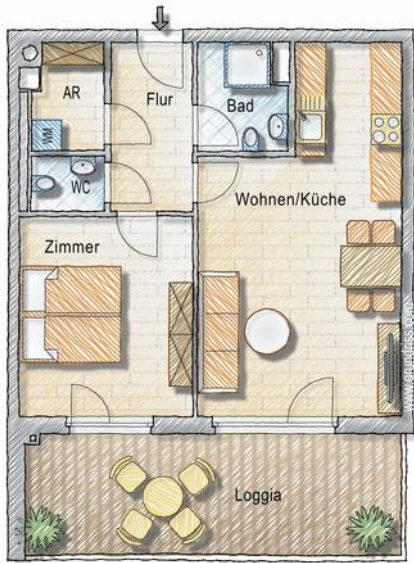
Grundriss - 2 Zimmer